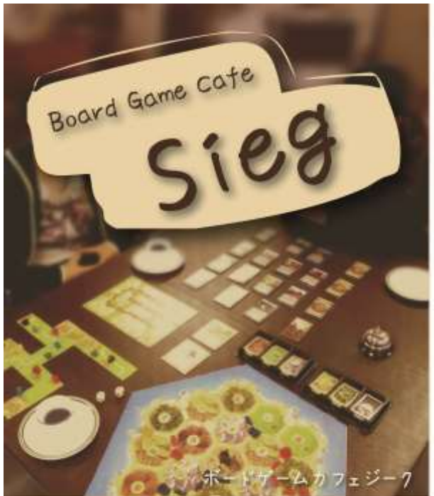
ボードゲームカフェジーク

「ボードゲームってしたことないんだけど大丈夫？」というひとから、「リーダーと一緒にゲームしながらいろいろな話をしたい」というひとまで、誰でも参加OKです。友達とおさそい合わせの上、ご来店いただけることを心よりお待ちしております。