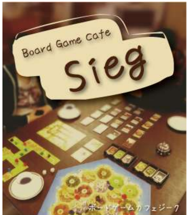
ボードゲームカフェジーク